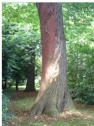
, 24 Août 2005

XLSX (Excel 2007) - XLS (Excel 1997-2003) .